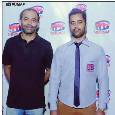
Diretoria do Sispumaf convida servidores

Evento será realizado na sede do Rotary Clube no dia 3 de novembro