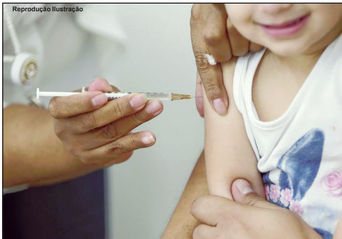
Ministério da Saúde mobiliza unidades de todo o País contra o sarampo