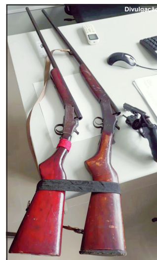
Espingardas Boito e revólver Taurus apreendidos pela PC