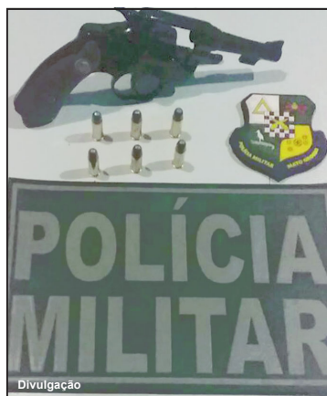
Revólver calibre 32 apreendido pela PM

investigação sobre as ameaças e indiciar o acusado por posse ilegal de arma de fogo.