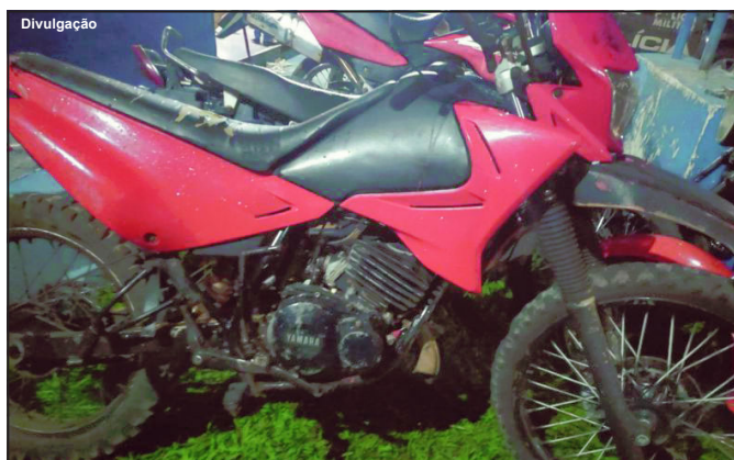
Veículo totalmente adulterado foi apreendido e encaminhado à Delegacia

Vítima de 43 anos ainda treme ao falar do caso ocorrido na sexta-feira, dia 18