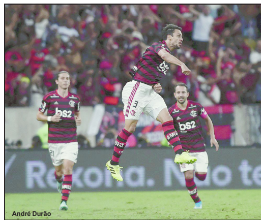
Flamengo vibra ao passar bonito à grande final