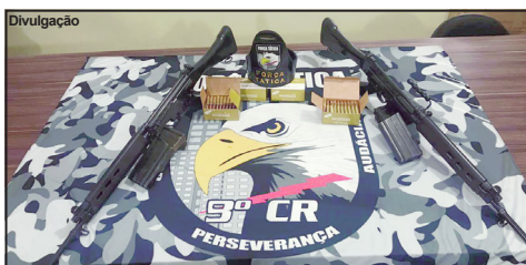
Fuzis recebidos pela Força Tática da PM em AF