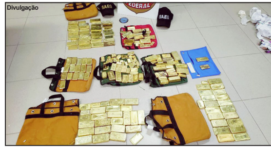
Conforme investigação da PF, empresas da região estariam envolvidas

Uma das prováveis minas, de onde teria sido extraído parte do ouro apreendido, não estava em funcionamento, o que corrobora a