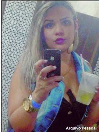
Matador chegou atirando e mulher alvejada morreu na hora