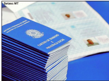
Trabalhadores devem procurar Sine em AF

Segundo Valdeci Alves Pires, tem pelo menos 600 carteiras novas no Sine Alta Floresta