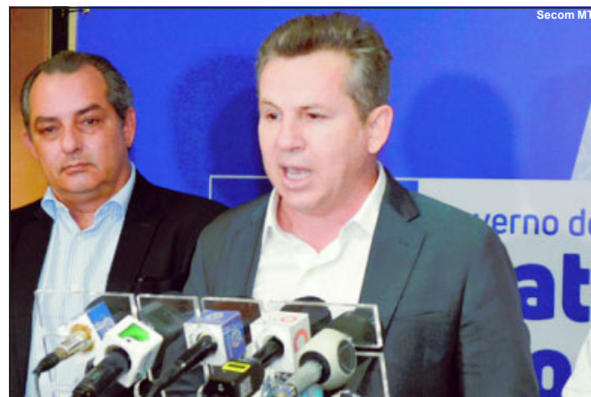
Governador Mauro Mendes aguarda resultado de estudos