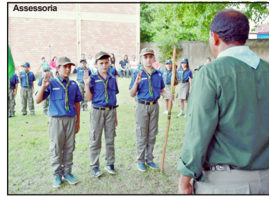
Evento realizado em Nova Monte Verde

O Escoteirismo é um projeto educacional complementar, que auxilia na formação dos jovens para se tornarem adultos responsáveis e contribuintes para a sociedade em que vivem. Buscando promover o protagonismo juvenil, utiliza como metodologia o "Aprender Fazendo" onde o escoteiro é responsável pelo seu próprio desenvolvimento e conquistas. De acordo com a diretoria, o GE está de "portar abertas" para receber novos