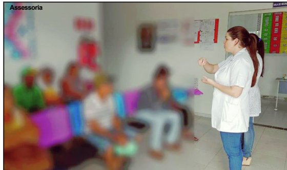
Secretaria de Saúde em Apiacás faz avaliação em pacientes