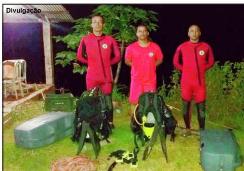
Militares dos Bombeiros que atuaram no resgate

Bombeiros foram acionados para resgatar o corpo do homem de 31 anos