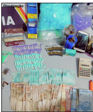
Muita droga e dinheiro apreendido pela PM no município de Colíder

Caso foi registrado pela Polícia Militar no final de semana