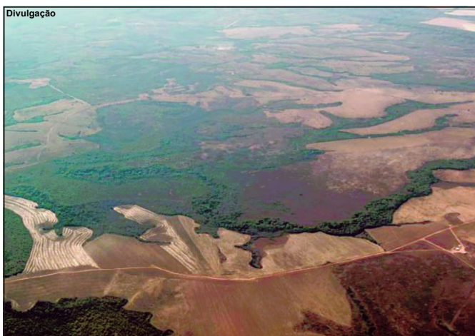
Instituto de Terras faz alterações em metodologia de cálculo