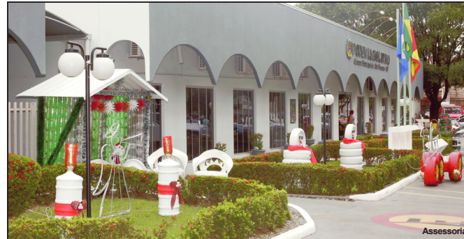
Clima natalino toma conta da Câmara de Vereadores de AF

Parceria do Poder Legislativo com as escolas está transformando o estacionamento da Câmara Municipal em um espetacular ambiente natalino.