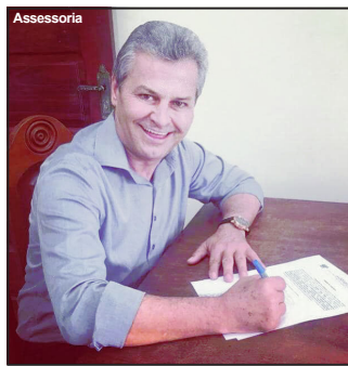
Prefeito Adalto Zago mostrando transparência em suas contas