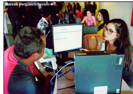
Governo esperava uma arrecadação bem maior

Previsão era arrecadar R$ 150 milhões entre a primeira parcela e pagamento à vista. Valor final ficou em R$ 59,8 milhões. Contribuintes ainda podem contar com os descontos em juros e multas até 30 de dezembro