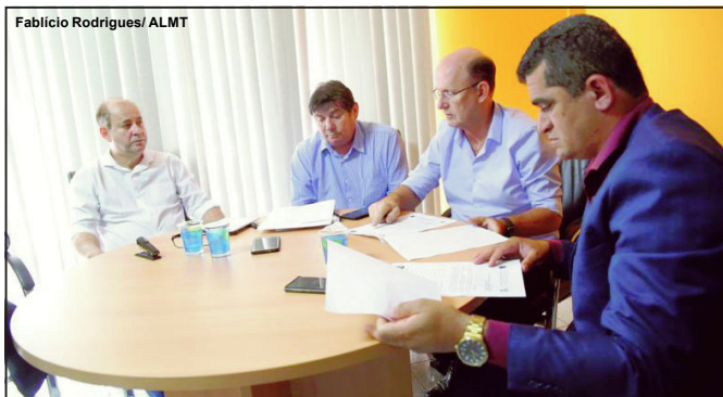
Parlamentares foram recebidos em visita técnica