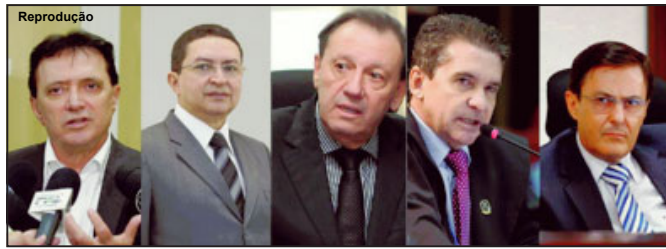
Conselheiros afastados do Tribunal de Contas do Estado

Caso deve entrar na pauta das sessões do dia 18 ou 19 de dezembro