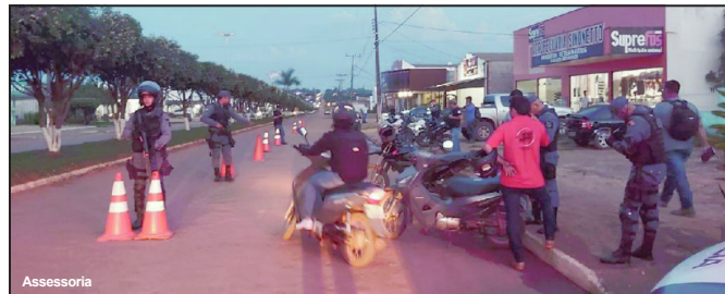
Operação visa reduzir número de acidentes na região