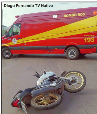
Choque mecânico aconteceu próximo do Corpo de Bombeiros

Caso aconteceu na manhã de quinta-feira na entrada para o Bairro Boa Nova I