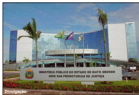
MP do estado entrou com ação contra AL MT

Caso o Poder Judiciário não reconheça a inconstitucionalidade, o Ministério Público pleiteia a nulidade dos atos administrativos