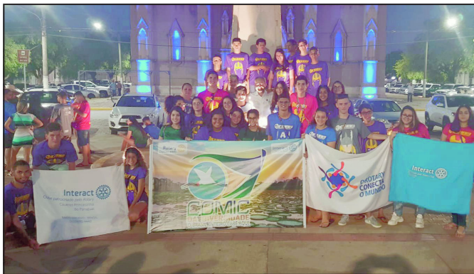
Rotary clube de Alta Floresta compareceu com os seus Interactianos em Cáceres na Odic 2019