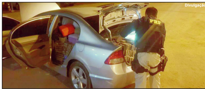
Civic cheio de maconha tinha como destino o estado de Mato Grosso

Delegado informou que droga certamente seria distribuída pelo estado