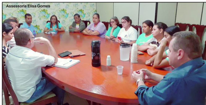
Reunião realizada na sala de reuniões da Prefeitura de Alta Floresta

Verba seria destinada pelo Governo Federal uma vez ao ano para os ACS