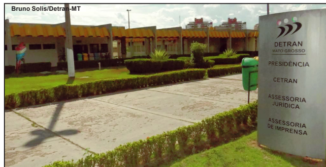
Projeto deve ser sancionado pelo Governo nos próximos dias

Hoje a incidência do número de veículos removidos aos pátios do Detran-MT representa 0,67% da frota, 14.686 veícu-