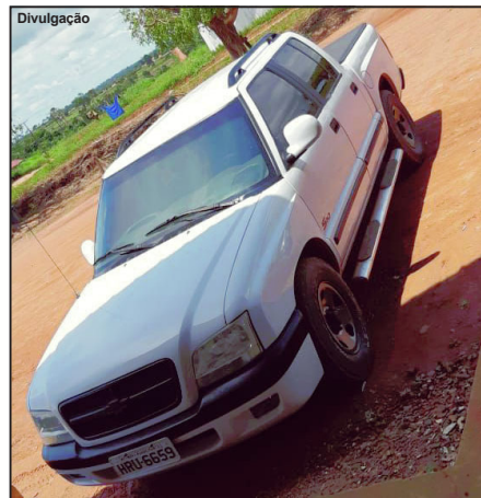
Caminhonete da família vítima de roubo

A Polícia iniciou uma varredura e depois descobriu a caminhonete abandonada nas imediações do distrito de Japurana, cerca de 30 quilômetros do núcleo urbano da cidade de Nova Bandeirantes. O caso segue investigado.