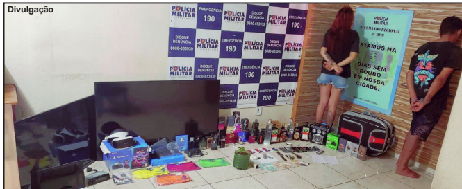
Suspeitos e material apreendido foram levados para a Central da PM

No caso em Alta Floresta uma jovem de 18 anos e um homem de 26 foram presos