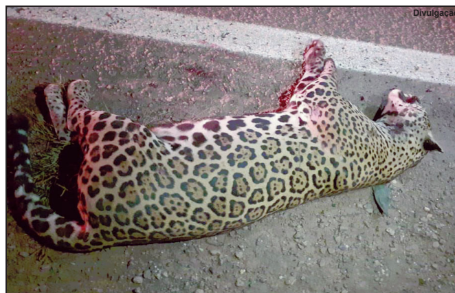
Fêmea foi morta atropelada na Rodovia MT-208 em Alta Floresta

A onça-fêmea, já adulta foi atropelada a cerca de 20 quilômetros de Alta Floresta sentido município de Carlinda. O fato aconteceu por volta das 18:30 horas de quarta-feira, dia 18 quando Corpo de Bombeiros foi acionado para atender um casal que estava de moto que tinha sido vítima de acidente.