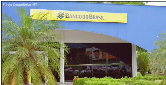
Funcionários do estado já podem sacar dinheiro segundo o governo