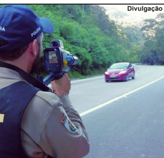
Radares devem voltar às estradas

O magistrado afirma que o ato foi tomado sem embasamento técnico e que a abstenção