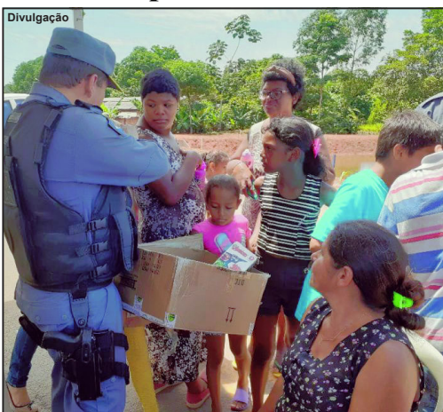
Comandante regional da PM distribuindo donativos