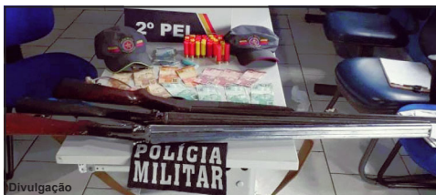
Armamento apreendido em Nova Canaã do Norte