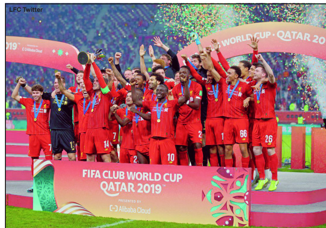
Liverpool campeão Mundial

Ele disse que apesar do susto pretende aproveitar o feriado prolongado para fazer sobrevoos com a família.