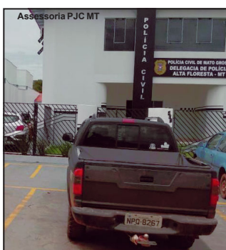
Veículo apreendido em operação da Polícia Civil em Alta Floresta

No primeiro dia de ação pelo menos 100 veículos foram abordados e vistoriados. Quando muitos condutores pensavam que a operação já tinha acabado, barreiras eram feitas em outros pontos do município. Assim a Polícia acabou encaminhando condutores para a Delegacia Municipal de Polícia Civil e apreendendo dois veículos.