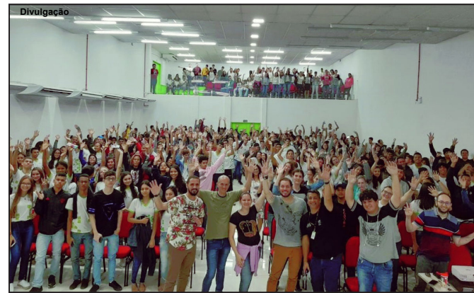
Evento no Auditório do IFMT no município de Alta Floresta

“Os dois dias de English Camp no Campus Alta Floresta foram ótimos. Os estudantes tiveram a oportunidade de participar de aulas de Língua Inglesa sobre diversos conteúdos do Ensino Médio e com diferentes professores, tanto