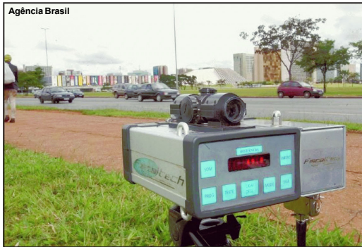
Radares voltarão a ser utilizados nas estradas