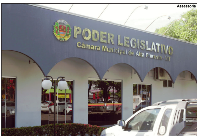
Assunto foi discutido nesta segunda-feira na Casa de Leis em AF

Polêmica e complexa, matéria era o principal assunto em sessão extra