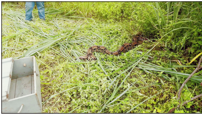
Trabalhador roçava quando se deparou com animal na sua frente

Corpo de Bombeiros foi acionado por trabalhador na manhã desta segunda-feira, 6