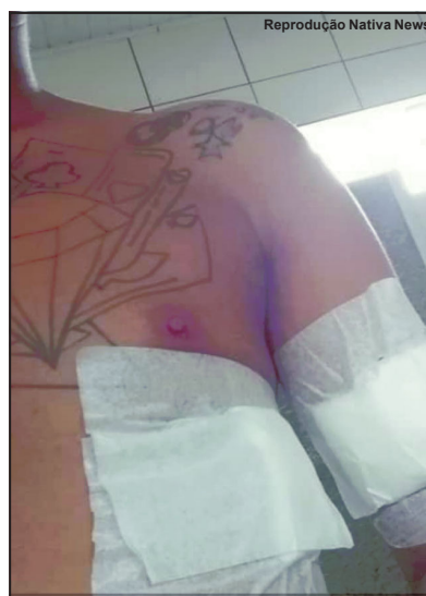
Jovem baleado está em recuperação

O jovem recebeu os primeiros socorros ainda em Nova Bandeirantes, mas depois foi transferido para o Hospital Regional em Alta Floresta. Segundo informações, já estaria fora de risco.