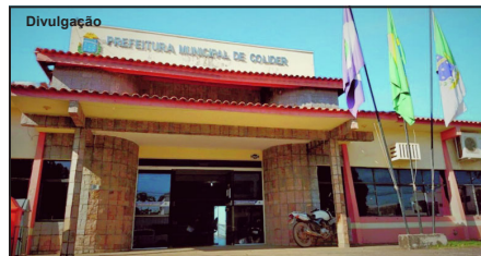
Prefeitura anuncia provas para 16 de fevereiro