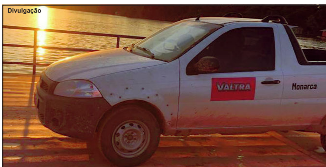
Pick-up levada na noite de domingo é adesivada com marca da empresa

Veículo foi levado da frente de uma oficina na noite de domingo