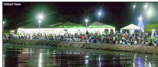
População de Paranaíta e visitantes comemoraram juntos a chegada de 2020

terceiro ano consecutivo atraiu milhares de pessoas na noite de 31 de dezembro de 2019. Famílias inteiras, grupos de amigos de todas