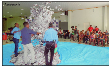
Momento do sorteio de milhares de cupons

A CDL Alta Floresta realizou na tarde desta sexta-feira (03.01) o sorteio de mais de R$ 60 mil em prêmios da Campanha Ano Novo Vida Nova (2019/2020). O sorteio aconteceu no auditório Ariosto da Riva e contou com a presença de um bom público.