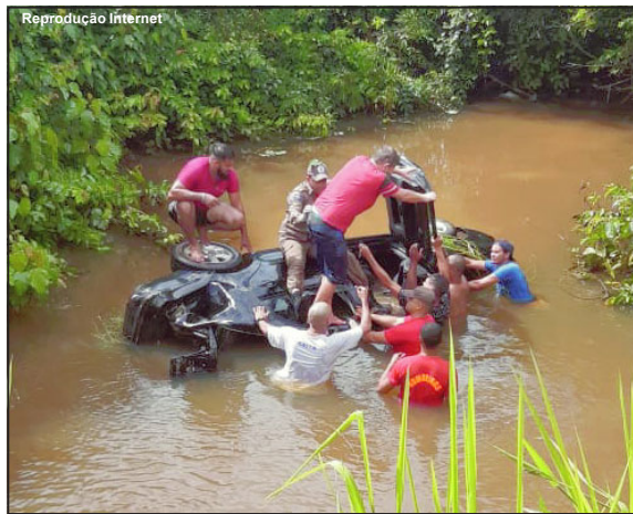
Bombeiros e voluntários na operação de resgate em Alta Floresta/MT – Um acidente automobilístico por pouco não

No caso em Alta Floresta a menina saiu do carro primeiro e correu para pedir ajuda