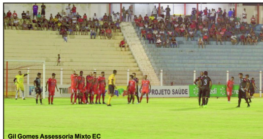
União vence Mixto