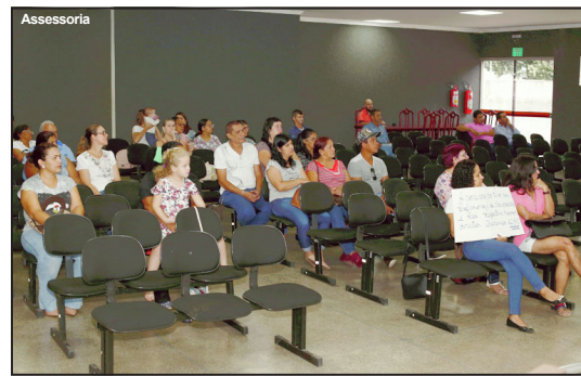
Público acompanhando votação na Câmara de Alta Floresta

Reajuste também será aplicado aos cargos de prefeito, vice-prefeito e secretários. Reajuste também será aplicado nos benefícios concedidos pelo Ipreaf.