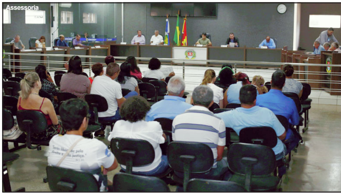
Sessão extra realizada pela Câmara Municipal de Alta Floresta

Vereadores abrem mão da revisão dos seus subsídios, como haviam feito nos últimos três anos quando também aprovaram somente o reajuste dos servidores do Legislativo Municipal.