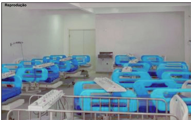
Obra de construção dos leitos de UTIs em Alta Floresta