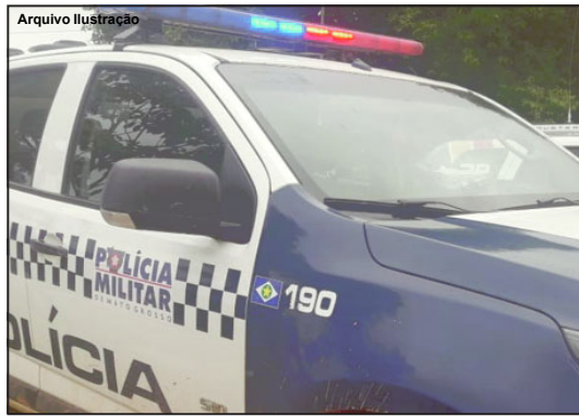
Polícia Militar isolou local até a chegada da Perícia