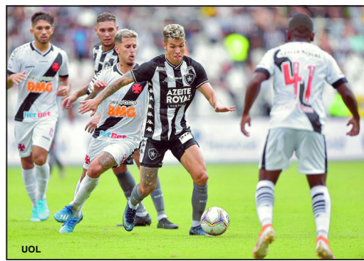
Botafogo vence e elimina o Vasco