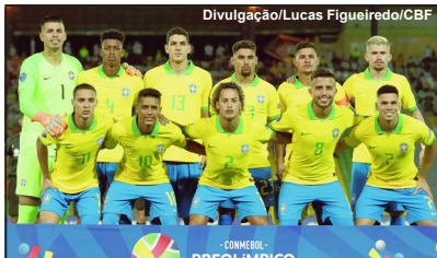
Seleção brasileira sub-23 invicta