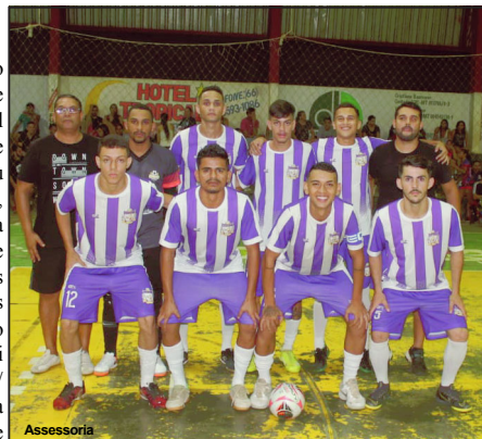
4º Torneio de Futsal de Férias