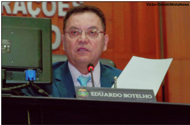
Início do ano legislativo 2020

Presidente da Casa de Leis dá início aos trabalhos de 2020 e fala sobre ações tomadas por deputados