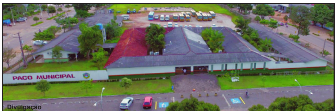
Paço Municipal de Alta Floresta