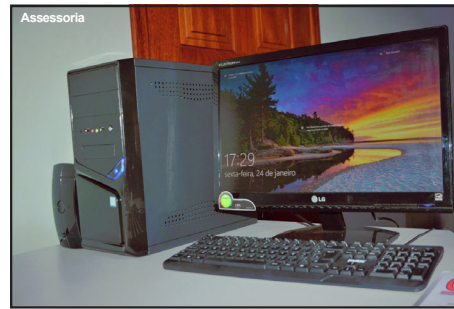
Investimentos na administração de Paranaíta