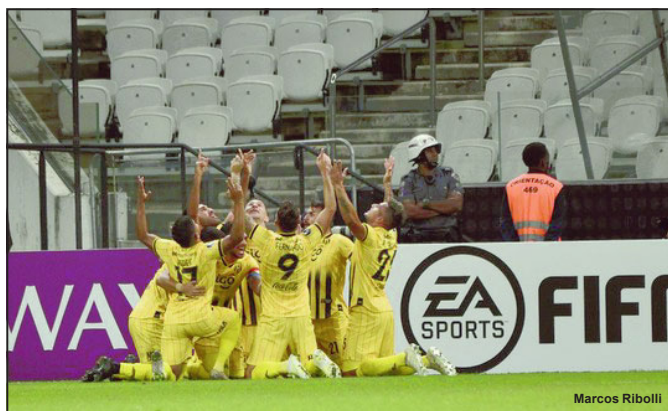
Jogadores do Guarani comemoram gol em Itaquera