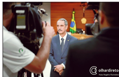
TJMT homologou o resultado final do concurso

O concurso para Cartórios no Estado de Mato Grosso foi realizado em 2013 e até hoje aguarda conclusão. As vagas oferecidas no certame estão atualmente preenchidas por interinos sem concurso, sendo que a Constituição Federal de 1988