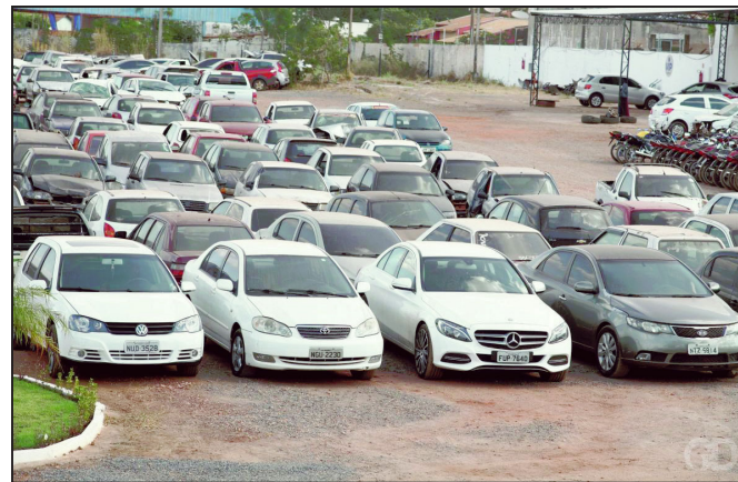
O projeto de lei foi aprovado na sessão de quarta-feira

O suspeito tentou fugir, mas foi imobilizado. Os dois suspeitos foram entregues na delegacia de polícia juntamente com o veículo e as notas falsas para as providências necessárias.