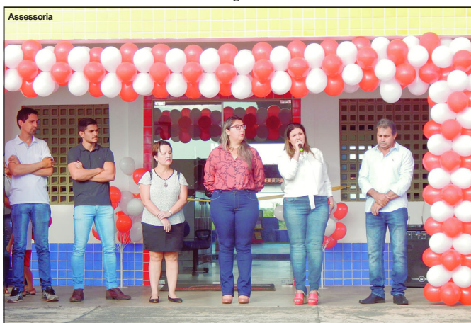
Centro Municipal de Educação Infantil Reino Encantado

Após quase perder a Projeto, a obra da Creche foi retomada em 2018 com várias irregularidades.