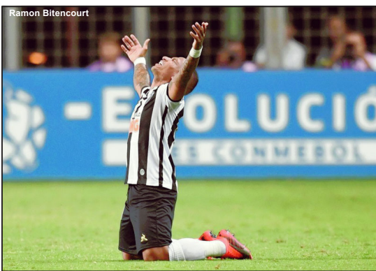
Otero foi destaque mesmo com a eliminação

tem totais condições de reverter o placar jogando no Serra Dourada. O outro brasileiro é o Fortaleza que fez grande jogo contra o Independiente na Argentina, perdeu por 1-0 e agora trás a decisão para o Castelhão onde conta com o apoio de sua apaixonada torcida e do bom momento da equipe para tentar a classificação.