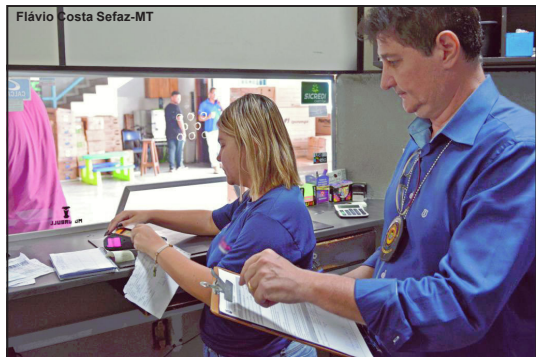
Sefaz notifica comércio