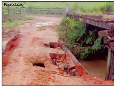
Reprodução Comunidade em risco de isolamento

“As estradas estão feias, mas ainda estamos conseguindo passar. Muito problemas com os ônibus do Transporte dos alunos que quebra constantemente. As pontes estão muito precárias. Até agora ainda não comprometeu as aulas, mas a situação é muito preocupante, se a prefeitura não tomar