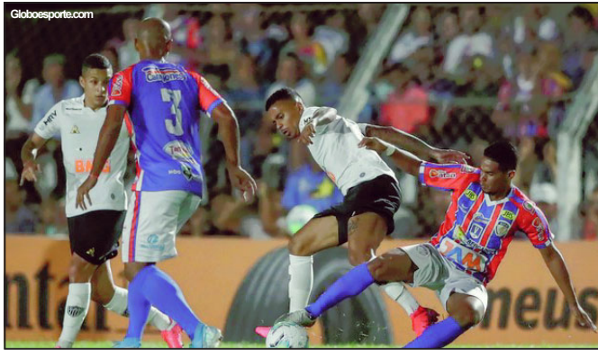
Afogados vence Atlético-MG