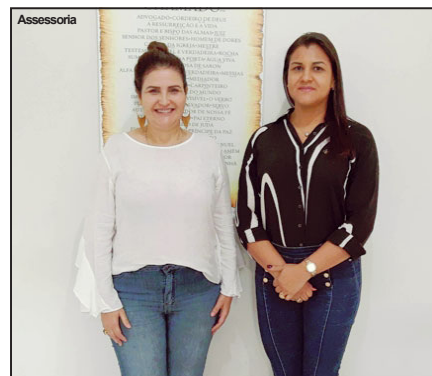
Apoio a ampliação da delegacia municipal