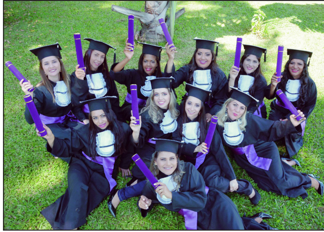
Formatura da turma de Pedagogia

Deus nunca perturba a alegria dos seus filhos se não for para lhes preparar uma mais certa e maior. Alessandro Manzoni