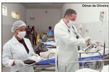
A SMS emitiu nota de esclarecimento