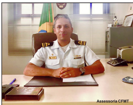
Motos aquáticas são as que mais matam