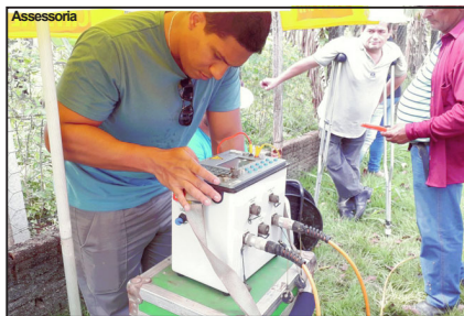
Parceria beneficiará agricultura familiar

Serão perfurados cinco poços artesianos no assentamento Julio Firmino (Vila Rural II), dois poços no assentamento Nossa Senhora Aparecida (Vila Rural I), um na Pista do Cabeça, um na Pista Nova, um na Cooperplan e um na Cooperativa Ouro Verde. As perfurações devem se iniciar no