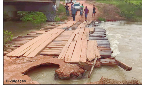
Tráfego no local ficou restrito em Nova Monte Verde