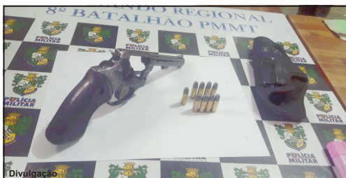
Arma apreendida pela PM e munições foram encaminhadas à Delegacia de Polícia Civil

Arma estava carregada e suspeito ainda tinha outras três munições no bolso