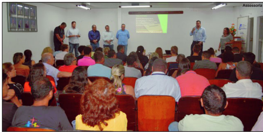
Projeto estudará potencialidades e deficiências de segmentos econômicos

Durante a apresentação, além da equipe de pesquisadores, o secretário estadual de