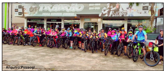
Ciclistas saíram para o pedal bem cedo no domingo, dia 8