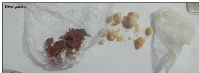
Droga encontrada foi apreendida e passará por perícia na Politec

somente uso de bebida alcoólica, mas os policiais fizeram uma busca e encontraram porções de maconha, pasta base de cocaína e ainda dinheiro com os suspeitos. “Um deles falou que havia comprado a droga do marido dessa jovem”, comentou Sargento Bento, da Força Tática, alegando que o indivíduo apontado já tem várias passagens pela polícia. Uma prisão do elemento aconteceu