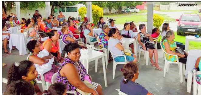
Evento realizado quinta-feira na cidade de Apicás