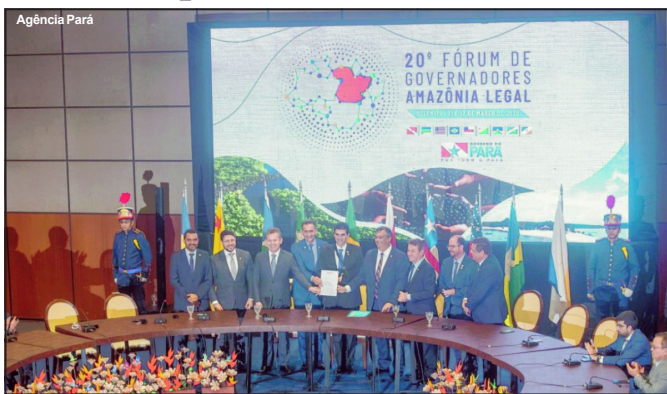
Governador de Mato Grosso em evento com outros líderes de estados