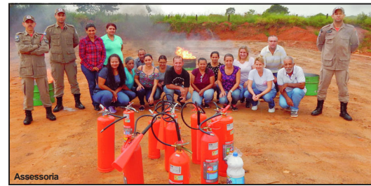
Evento aconteceu entre os dias 9 e 11 de março