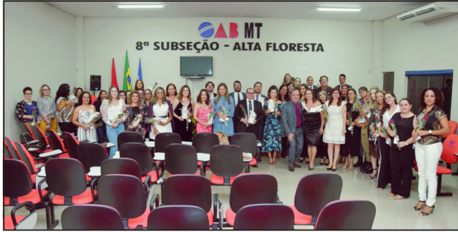
A 8ª subseção da Ordem dos Advogados de Alta Floresta faz uma homenagem ao mês da mulher.