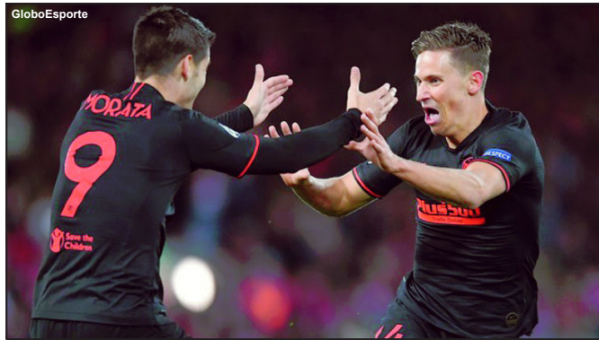
Morata e Llorente estiveram em grande noite