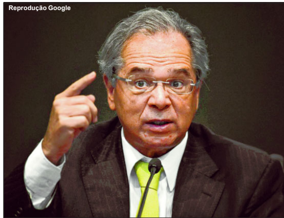
Paulo Guedes falou em medidas para combater efeitos da pandemia

O ministro da Economia, Paulo Guedes, afirmou nesta sexta-feira (13) que pretende anunciar novas medidas para combater os efeitos da pandemia do