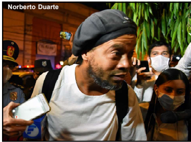
Ronaldinho sai da cadeia no Paraguai