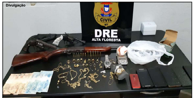
Vítimas de roubos reconhecem pertences divulgados pela imprensa

Parte dos produtos apreendidos pela Polícia Civil foi reconhecida por uma vítima