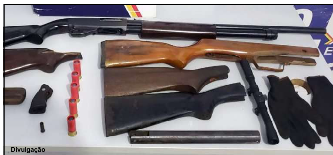
Espingardas e munições apreendidas na região de Peixoto de Azevedo

O suspeito acabou confessando que possuía a espingarda e que ela estaria com irmão (segundo suspeito preso), no bairro Centro Novo. No quarto dele, foi apreendida a espingarda, uma sacola com as munições e diversas peças de arma, além das roupas camufladas do mesmo modelo das que foram usadas nos últimos roubos nos garimpos.