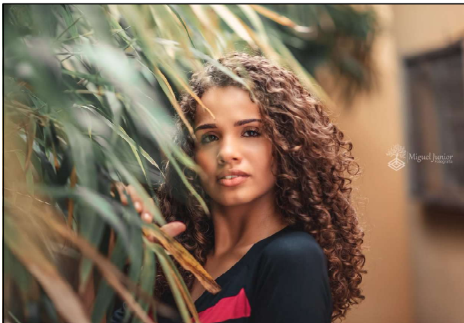
Camila tem um olhar marcante