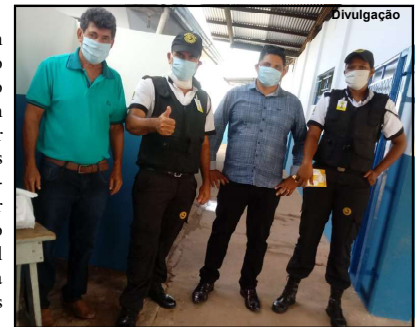
Agentes de segurança também prevenidos