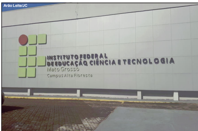
Campus do IFMT no município de Alta Floresta receberá o investimento

IFMT se reuniu na manhã desta quarta-feira com prefeitos da região