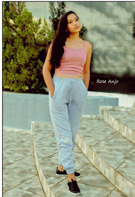
Manu com seu jeito delicado