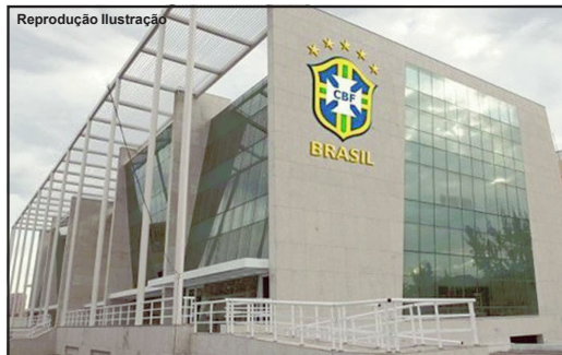
CBF começa tentativa de retomada dos jogos