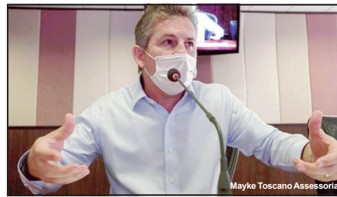
Governador Mauro Mendes analisa ações do presidente

Além de Mauro, assinam a carta os governadores Renan Filho (AL), Waldez Góes (AP), Rui Costa (BA), Camilo Santana (CE), Renato Casagrande (ES), Ronaldo Caiado (GO), Flávio Dino (MA), Reinaldo Azevedo (MS), Helder Barbalho (PA), João Azevedo (PB), Paulo Câmara (PE), Wellington Dias (PI), Wilson Witzel (RJ), Fátima Bezerra (RN), Eduardo Leite (RS), Carlos Moisés (SC), João Dória (SP), Belivaldo Chagas (SE) e Mauro Carlesse (TO).