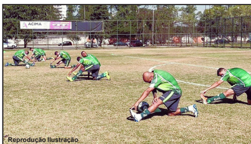
CBF começa tentativa de retomada dos jogos

A confirmação se dá depois da desistência do Patrocinense (MG) e do São Caetano, a diretoria dos clubes comunicou a CBF que devido a questões financeiras abriram mão de suas vagas na disputa da Série D. O EC São Bernardo reivindicou a vaga deixada pelo São Caetano, mas a CBF negou o