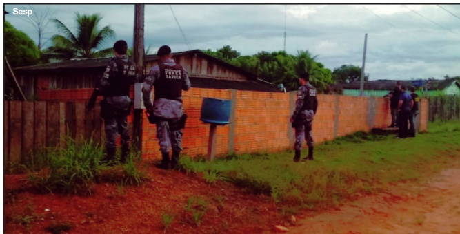
Operação pegou moradores de surpresa na cidade de Colniza