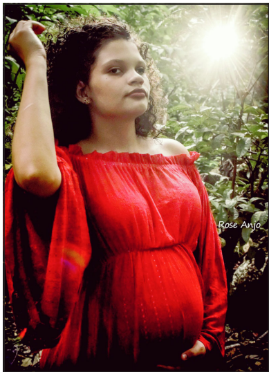
A linda Jeniffer com 29 semanas de gestação