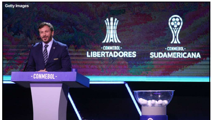
Alejandro Domínguez, presidente da CONMEBOL