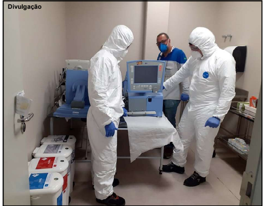
Estados estão providenciando nova compra de respiradores

O ministério tinha a previsão de distribuir