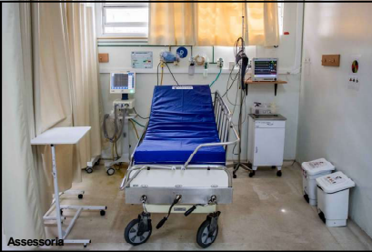
Investimento entregue no município de AF

O Hospital Regional de Alta Floresta inaugurou, nesta quarta-feira (01.04), 10 novos leitos de Unidade de Terapia Intensiva (UTI) adulto. A obra, que estava paralisada desde 2016, foi retomada em 2019 pela Secretaria de Estado de Saúde (SES-MT), após o lançamento do projeto de modernização dos Hospitais Regionais e das Unidades Especializadas, idealizado e colocado em prática pela atual gestão.