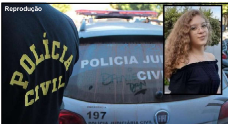
Adolescente morta por menor na cidade de Sorriso