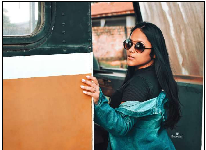
Um charme da linda Vitória