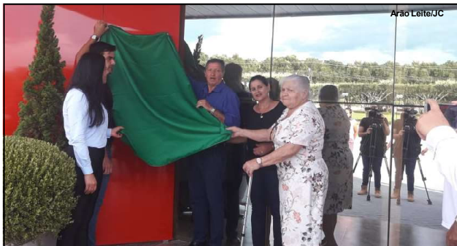
Momento histórico marcado por cerimônia na tarde de quinta-feira, dia 2

Unidade reformada e ampliada conta com equipe especializada e 40 leitos