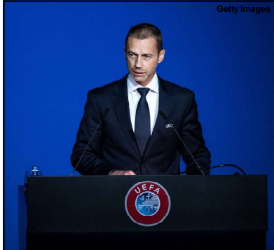
Aleksander Ceferin, presidente da UEFA

- O futebol não é de longe o mesmo sem os torcedores. Mas é definitivamente melhor jogar sem os torcedores nas arquibancadas e ter novamente o futebol na televisão do que não ter absolutamente nada. É isso que as pessoas querem e isso devolve a energia