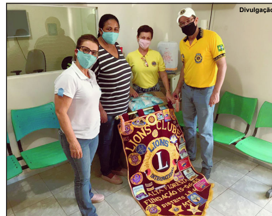
Registro da entrega do material ao Hospital Regional

registrados 10 casos positivos para COVID-19, um caso em Nova Monte Verde e nove em Alta Floresta.