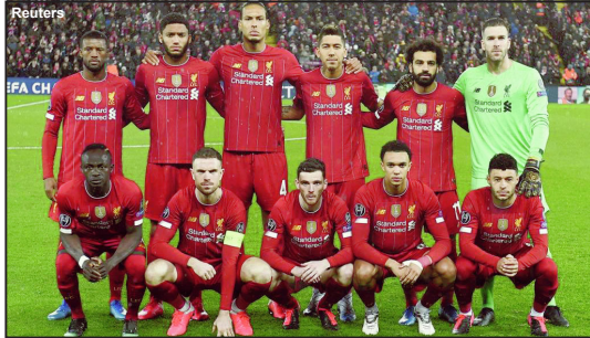
Liverpool lidera a Premier League

O "plano remeço" foi muito discutido entre a Premier League e seus clubes integrantes ao longo da última semana, sempre com participação das autoridades