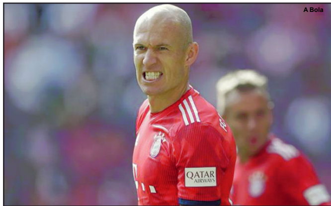
Robben no Botafogo? Clube vai atrás de jogador