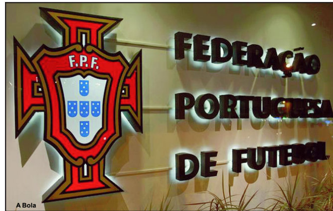
FPF aprova remodelação da liga