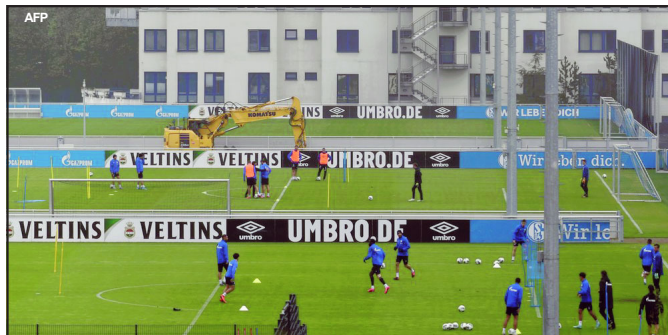
Jogadores do Schalke 04 treinam separados