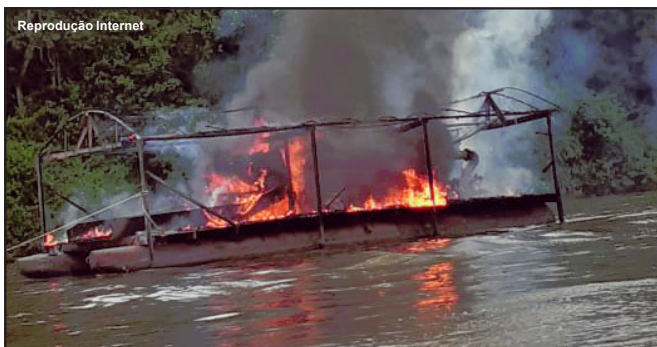
Balsa destruída no Rio Teles Pires essa semana no norte de MT

Segundo informações, a ação do Ibama aconteceu entre quarta e quinta-feira