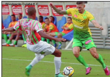
Cuiabá x Operário pela fase de grupos