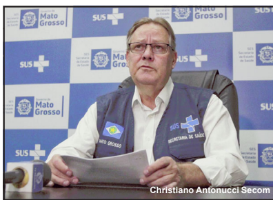
Secretário de estado de saúde de MT