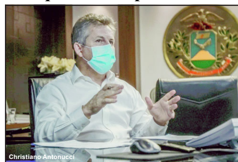
O governador Mauro Mendes avaliou que o caixa do Estado está preparado para a crise