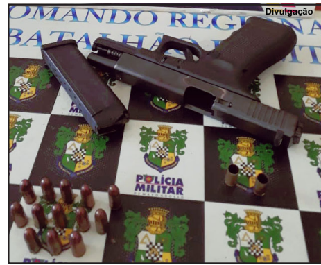
Pistola apreendida foi encaminhada para perícia

“Não descartamos que essa arma usada para matar o rapaz possa ser a mesma pistola apreendida essa semana e que foi usada por uma dupla em tentativa de homicídio. A pistola foi apreendida e já encaminhada à Politec.