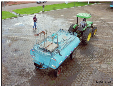
Trabalho sendo executado nas ruas de Colíder

A ação, que visa cuidados mais intensos à população, teve início quinta-feira (21) e já passou pela Caixa Econômica Federal e Praça Central. Outros pontos como Feira Livre, academias ao ar livre, escolas, postos de saúde, prefeitura e hospitais fazem parte do cronograma. Segundo o secretário de Infraestrutura