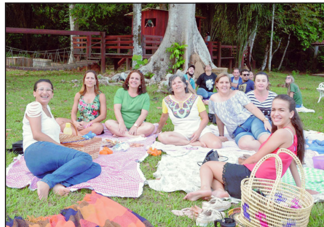
Lembrança de uma tarde de descontração da Família Anjo