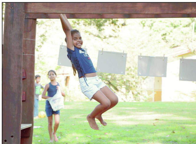
Vitória, ser criança é se divertir