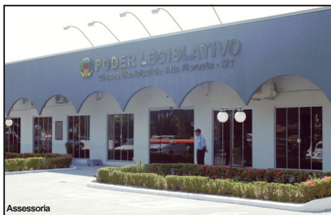
Poder Legislativo de Alta Floresta