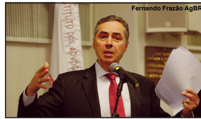
Luiz Roberto Barroso vai assumir TSE