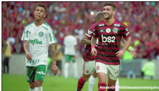
Clubes analisam possibilidade do retorno das competições

No último final de semana, a bola voltou a rolar no Campeonato Alemão, com jogos sem torcida. Além disso, como medida para evitar a contaminação, os atletas passaram por testagem e havia restrições na quantidade de pessoas que poderiam entrar nos estádios. Feldman sinalizou que o Brasil pode passar por algo semelhante. “Podemos ter sim só jogos com portões fechados... em países a epidemia vai e volta, tem novas ondas. Aglomerações mesmo só com vacina e controle absoluto”, disse.