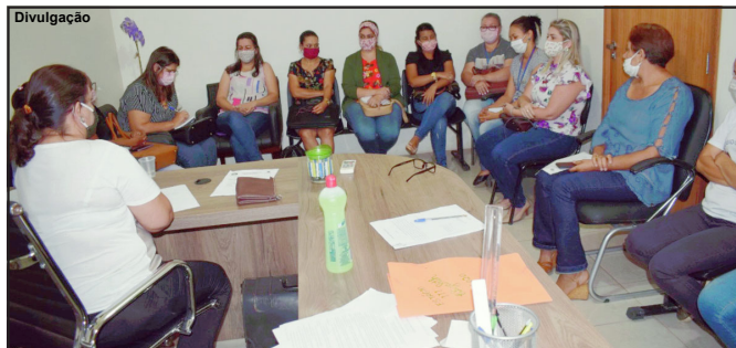
Câmara de Alta Floresta debatendo sobre ação social no município