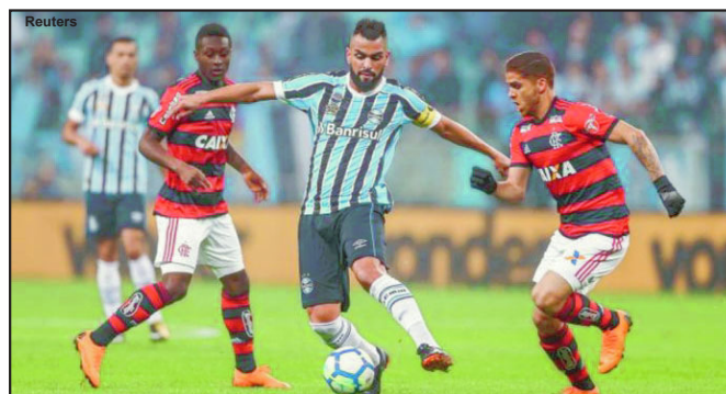
Grêmio x Flamengo pelo Brasileirão 2019

No Flamengo já está tudo preparado no Ninho do Urubu, jogadores e comissão técnica já foram testados e os protocolos já estão prontos. A diretoria rubro negra afirma