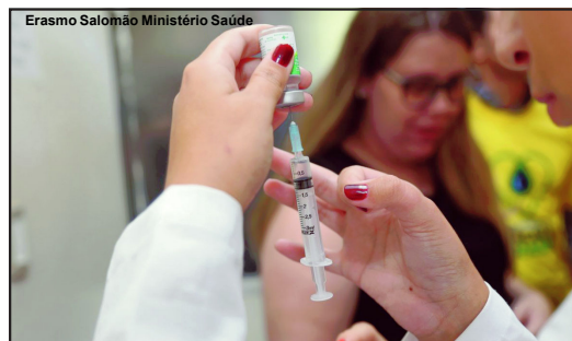
Erasmus Salomão Ministério Saúde

Grupos prioritários devem procurar unidades de saúde