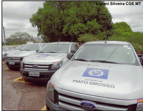
Locação de veículos no estado reduziu valor

Auditoria preliminar realizada pela Controladoria Geral do Estado (CGE-MT) detectou a redução de R$ 32 milhões nas despesas do Governo de Mato Grosso com locação de veículos nos últimos dois anos. Os gastos com locação de automóveis saíram de R$ 94 milhões no ano de 2018 para R$ 62,9 milhões em 2019.