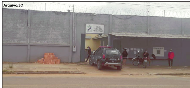
Seis agentes penitenciários de Alta Floresta foram infectados