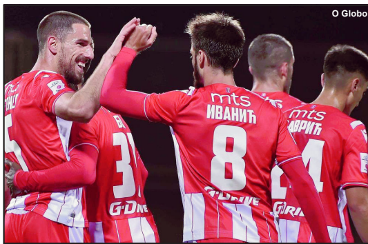
Estrela Vermelha é primeiro campeão pós pandemia

O futebol vai voltando após muitos países estabilizarem o contágio do COVID-19. Além da Alemanha, mais 12 países permitiram a volta dos jogos