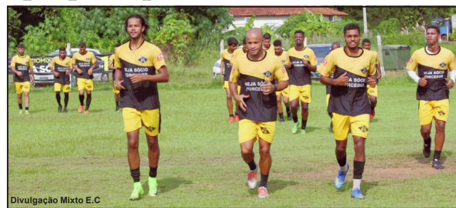
Jogadores do Mixto treinam antes da pandemia