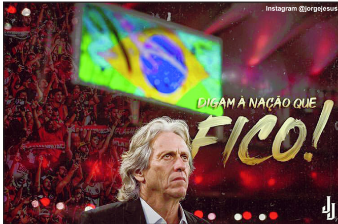
Jorge Jesus renova seu contrato com o Flamengo