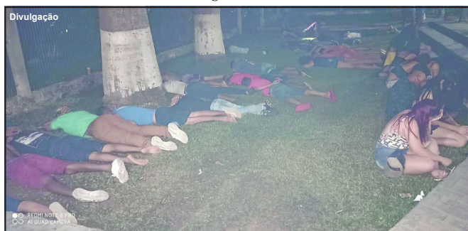
Menores foram todos catalogados e caso encaminhado à Delegacia

de Alta Floresta foi acionada para atender uma denúncia de aglomeração em uma chácara na primeira Vicinal Leste. Várias viaturas foram mobilizadas e no local a constatação de uma festa regada dos mais variados tipos de bebida alcoólica, cigarro, narguilê e jovens curtindo animados pelo som alto,