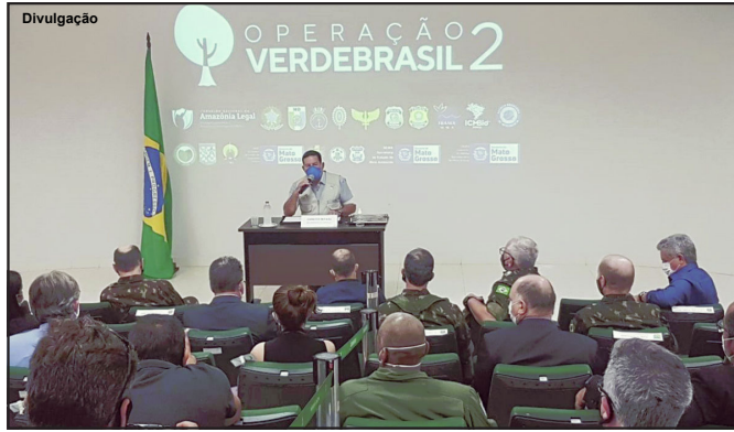
Vice-presidente Hamilton Mourão durante visita ao estado de Mato Grosso