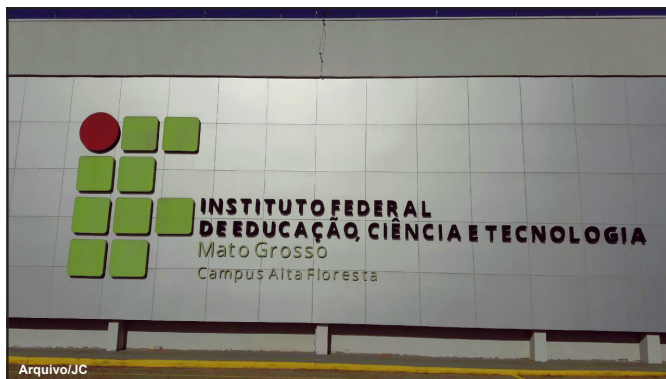
Instituição tenta via pesquisa, identificar impactos causados após covid-19