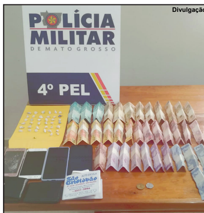
Dinheiro e celulares também foram recolhidos

No total a polícia recolheu 38 papelotes de pasta base de cocaína