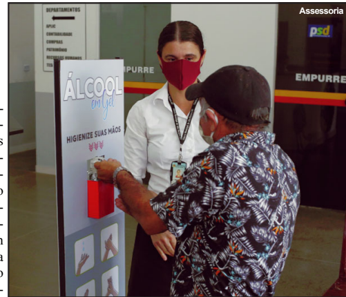
Ação é para melhor atender os visitantes

LINDOMAR LEAL Assessoria de Imprensa Câmara Municipal