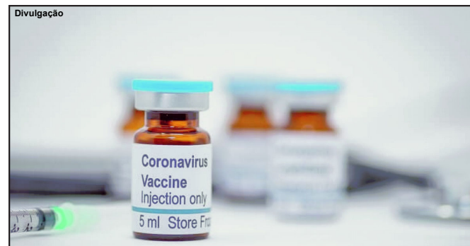
Expectativa é grande em torno da produção e distribuição da vacina