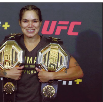
Amanda Nunes defende dois cinturões do UFC

“Eu sabia que ela era duríssima. Era a oponente que eu queria para acabar com essa história de que eu não chego bem ao quinto round. Estou muito feliz, é um momento maravilhoso, não tenho palavras para descrever. Hoje eu fechei um ciclo, sou a melhor de todos os tempos. Estou provando a cada dia, estou orgulhosa de mim, da minha academia e dos meus treinadores. Foram anos de dedicação, hoje parecia uma orquestra, eu escutava tudo que eles me falavam, foi perfeito. Declarou a