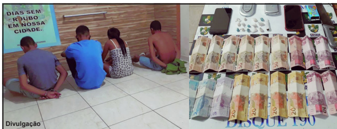
Grupo detido foi levado à Central de Operações com dinheiro e droga

Droga, dinheiro e balança de precisão foram apreendidas em residência