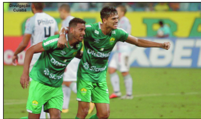
O Cuiabá é único representante do estado de Mato Grosso na série B

B do Brasileiro vão receber um adiantamento total no valor de R$15 milhões de reais, e os clubes da Série A, será disponibilizada uma linha de crédito de até R$100 milhões de reais, também a juro zero. Os recursos serão concedidos também como garantia aos valores que se referem aos contratos de direitos de