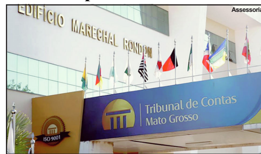
Tribunal de Contas do Estado de Mato Grosso