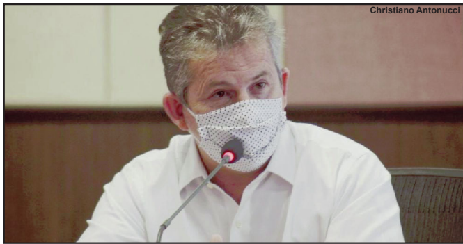
Mauro Mendes assegura que estado tem investido na saúde