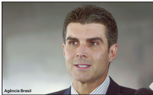
Helder Barbalho é o governador do Estado do Pará

A suspeita do Ministério Público Federal (MPF) é que os respiradores foram comprados de uma empresa sem registro na Anvisa, com preços superfaturados em 86,6%. A compra foi feita com base em decreto assinado por