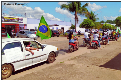
Manifestantes em frente ao presídio em AF

O movimento iniciou no grande Cidade Alta a partir do Bairro Vila Nova. Foi de lá onde segundo informações,