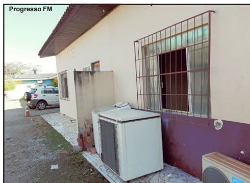
Local invadido por ladrões no município de Alta Floresta

Uma adolescente de 17 anos faz parte do trio levado à Delegacia