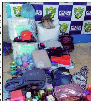
Produtos recuperados pela PM

A sociedade pode contribuir com as ações da Polícia Militar de qualquer cidade do Estado, pelo 190 ou, sem precisar se