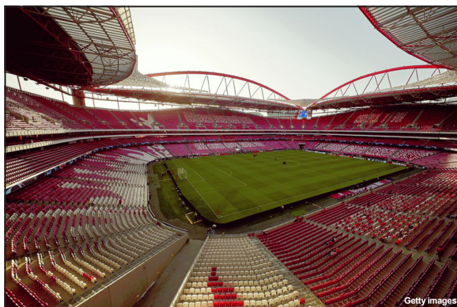
Estádio da Luz receberá jogos decisivos da Champions League