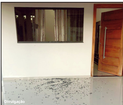
Janela da frente foi quebrada pelos ladrões

(12) e retornou no domingo, instante que notou que o portão estava fora do trilho (deslocado) e uma das janelas violadas.