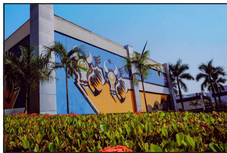
Governo estudando estratégias contra o corona

O sistema irá acompanhar, analisar e fazer a avaliação estratégica sobre a evolução do coronavírus em Mato Grosso, com base nos dados de crescimento da contaminação, na taxa de