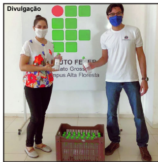
IFMT é parceiro na campanha