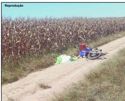
Corpo da vítima foi encontrado ao lado de sua moto

Disparo acidental pode ser a causa da morte da vítima que estava de motocicleta