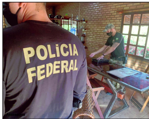
Essa é a terceira fase da Operação Tapiraguaia