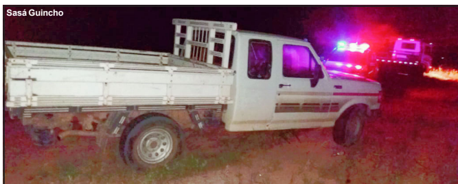
Veículo foi encontrado por um oficial da PM que seguia viagem para Colíder

Veículo levado na madrugada de terça-feira foi achado abandonado em Carlinda