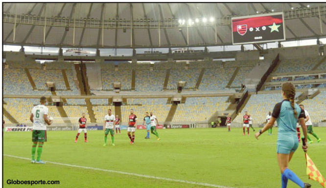
Flamengo x Portuguesa teve transmissão gratuita antes da paralização