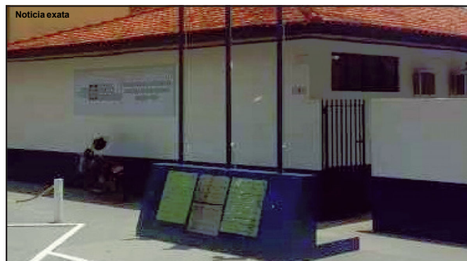
Sede do Indea na Avenida Ludovico da Riva no município de Alta Floresta