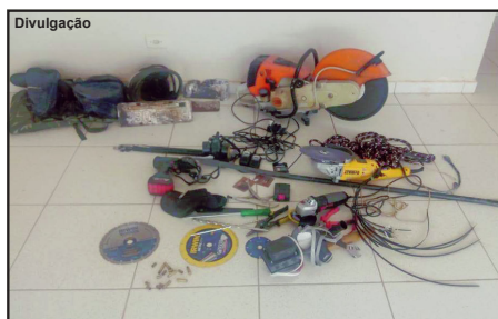
Material deixado para trás foi apreendido

Bandidos queimaram um carro, mas polícia interceptou e já prendeu três