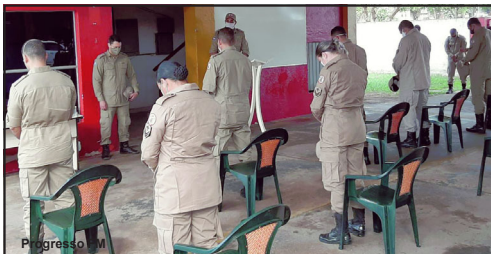
Solenidade simbólica respeitando recomendações

Na área de atuação do Comando Regional Bombeiro Militar VII - CRBM VII, três municípios estão no ranking das 20 cidades do Estado de Mato Grosso