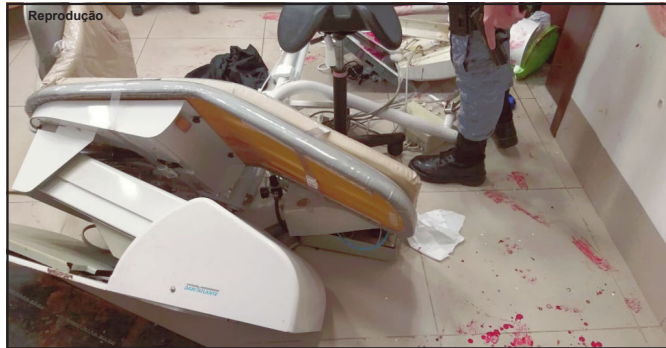
Clinica onde dentista acabou reagindo a um assalto na capital do estado