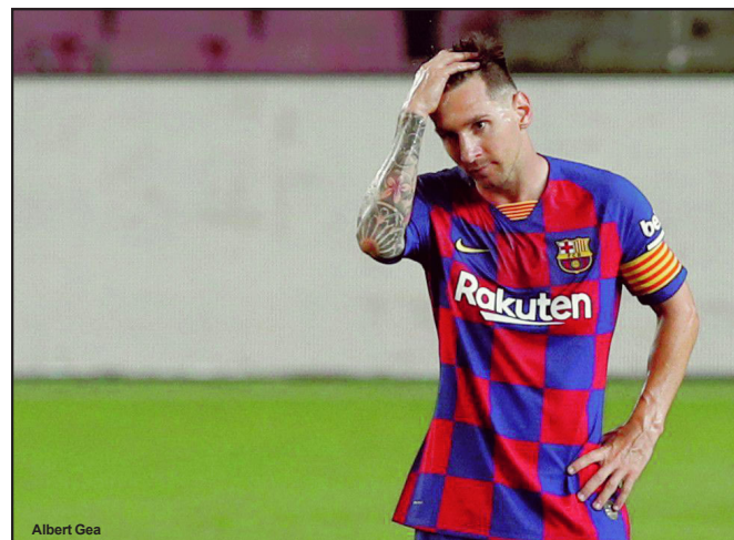
Messi ainda não renovou seu contrato com o Barcelona

tempo. Em meados de maio de 2019, Messi teria pedido a volta de Neymar, porque considerava que o Barcelona não tinha no momento um elenco suficientemente competitivo. No início desse ano, após a demissão do técnico Ernesto Valverde, o secretário-técnico do clube, Eric Abidal, teceu comentários em uma entrevista sobre supostos mal comportamento de atletas e falta de empenho, e que isso teria ajudado na demissão de Valverde. Messi, que em janeiro já tinha defendido publicamente Valverde e defendia a permanência do técnico, entrou em litígio com Abidal após as declarações feitas. Messi respondeu o dirigente do Barcelona em uma rede social dizendo que “se for falar de nós jogadores, deve-se dar nomes, porque se não acaba por se alimentar mentiras” e também que “cada