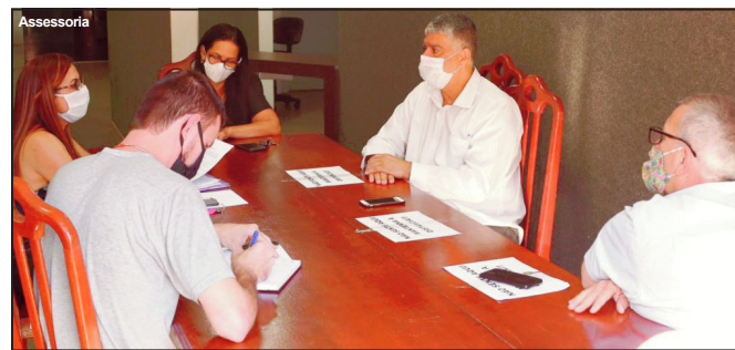
Comissão de Assuntos Relevantes avaliando gastos com covid-19 em AF

Conforme relatório, a comissão indicou ainda que o Comitê notifique os espaços privados com ampla circulação e fluxo de