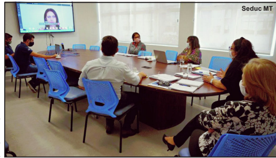
Secretaria de Estado de Educação discutindo volta às aulas

“As aulas off-line preveem a entrega de apostilas para os alunos que não têm acesso à internet. Os professores também poderão trabalhar com os alunos via whatsapp, fazendo estudo dirigido”, explica a secretária.