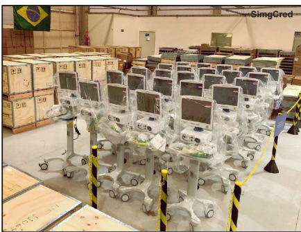
Aparelhos auxiliarão no enfrentamento ao corona

Os 50 respiradores adquiridos pelo Governo do Estado, por meio da Secretaria de Estado de Saúde (SES), têm previsão de chegada em Mato Grosso ainda esta semana. Os equipamentos foram embarcados na manhã desta quarta-feira (08.07), por lotes, no Aeroporto Internacional de São Paulo, em Guarulhos (SP), e começarão a chegar a partir desta quinta-feira (09). O transporte será feito gratuitamente pela empresa aérea Azul.