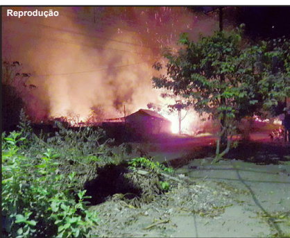
Fogo ameaçava avançar para residências

passada tinha atendido um caso próximo da ocorrência, tem sentido a ausência da Brigada Municipal, unidade geralmente usada nesse tipo de ocorrência. No entanto, ao ser acionado diversas vezes por moradores acabou agindo em duas ocasiões até finalmente exterminar as chamas.