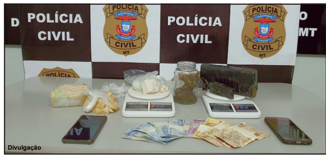
Polícia encontrou grande volume de droga em carro e casa de suspeitos

Ao fazer a checagem a Polícia Militar constatou o fato e logo que visualizou os pescadores fez a abordagem e detenção dos acusados, além da apreensão do material.