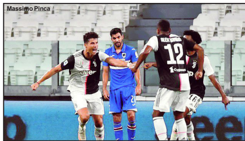
Cristiano Ronaldo chega ao 30º título na carreira

A Juventus de Turim sagrou-se campeã italiana pelo nono ano consecutivo, o 36º título da Velha Senhora veio com duas rodadas de antecedência ao vencer a Sampdoria por 2x0 com gols de Cristiano