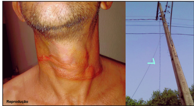
Vítima procurou polícia para prestar queixa em Alta Floresta

Homem de 52 anos registrou ocorrência e quer cobrar prejuízos