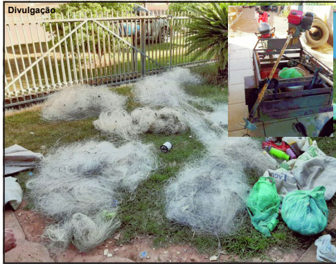
Material apreendido configurou pesca predatória

Material irregular como redes de pesca foram apreendidas na ação da Polícia Militar