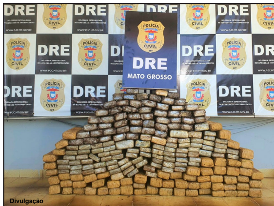
Droga foi apreendida no Distrito Industrial, em Cuiabá