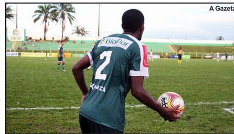
Luverdense pode não jogar a Série D