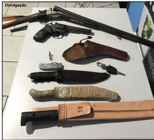
Espingarda, revólver, facas, facão e canivete apreendidos

em visível estado de embriaguez, ao questionar se havia armas no interior de seu veículo, o suspeito nada respondeu.