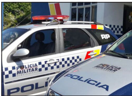
Polícia Militar foi acionada pelo Hospital Regional