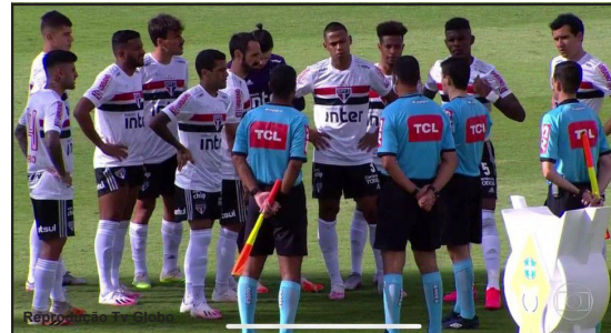
Jogadores do São Paulo são avisados do adiamento já no campo de jogo

falha grave no protocolo de saúde, o que causou o adiamento do jogo entre Goiás x São Paulo, entenda: O Goiás recebeu a equipe do Hospital Albert Sabin na quinta-feira (06) para a realização dos testes RT-PCR. Entretanto, o hospital solicitou uma nova coleta porque identificou uma falha técnica. O resultado saiu constando 10 contaminados dos 23 atletas testados que iria para o jogo, 8 são titulares do Goiás. O clube esmeraldino pediu uma posição da CBF para testar outros jogadores, não obteve resposta, portanto fez os testes num laboratório da cidade, recebendo as contra provas apenas em que 9 atletas testaram positivo, apenas momentos antes do jogo. Com a situação, o departamento jurídico do Goiás pediu o adiamento do jogo, o problema é que isso foi feito quando os jogadores do São Paulo e trio de arbitragem já estavam