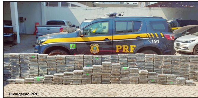
Cerco tem resultado em prejuízo milionário ao tráfico de droga

O Gefron atua na repressão aos crimes de tráfico ilícito de drogas, contrabando e descaminho de bens e valores, roubo e furto de veículos e invasões de propriedades. Denúncias podem ser feitas pelo 0800-646-1402.