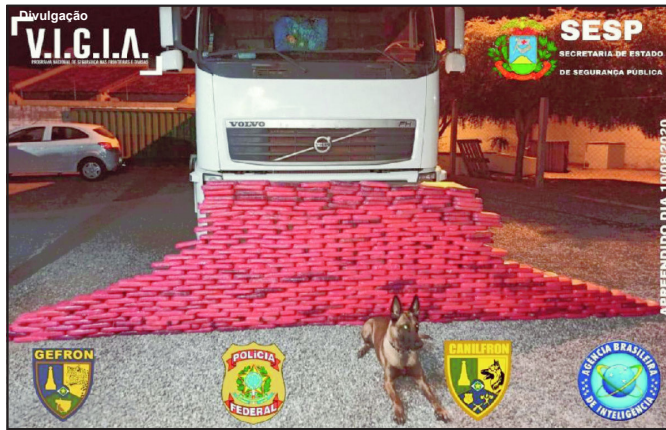
Droga estava escondida em compartimento de uma carreta