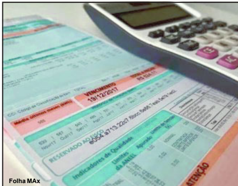
Contas absurdas são questionadas por consumidores

Ação do MPE aponta que faturas de consumidores de assentamento oscilaram significativamente sem nenhuma justificativa