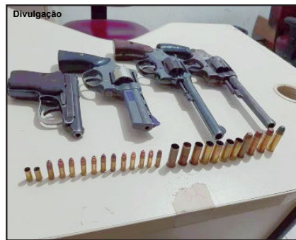
Armas estariam com suspeitos mortos