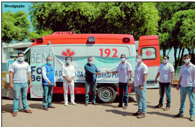
Cerimônia de entrega de ambulância ao município de Alta Floresta