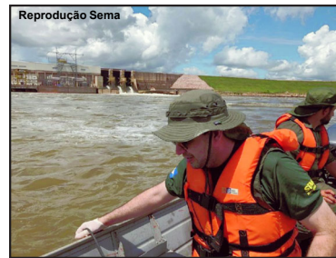
Sema começa apurar nova mortandade