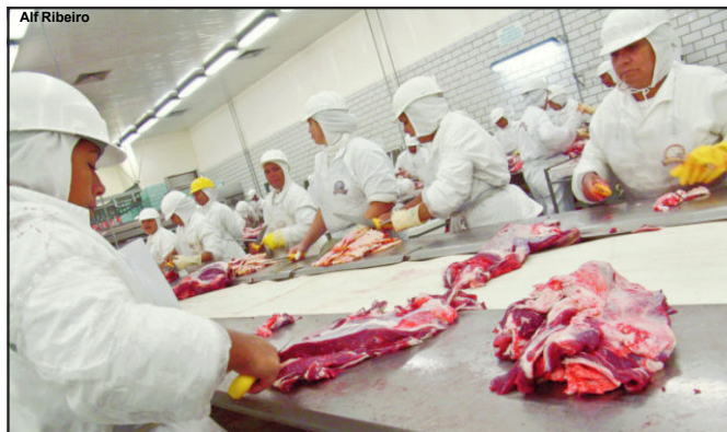
Indústrias frigoríficas retomando funcionamento normal em MT