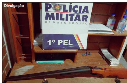
Espingarda usada por suspeito foi apreendida