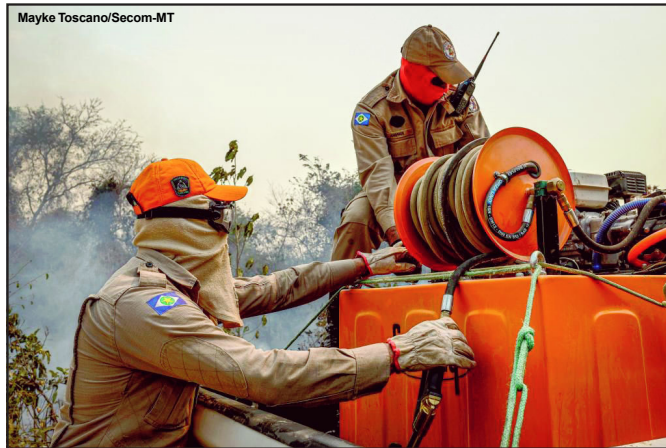
Bombeiros mato-grossenses durante combate aos incêndios