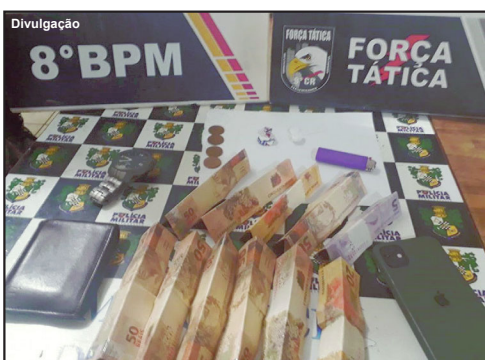
Suspeito também foi flagrado com dinheiro e droga

Ao fazer uma busca no local a PM encontrou o acusado, fez a abordagem