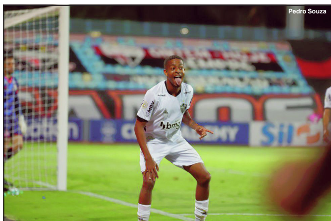
Keno marcou hat trick