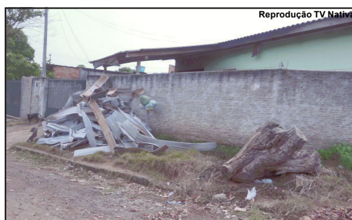
Destroços do incêndio em frente à residência

Antes mesmo da mulher chegar em casa a vizinhança notou a