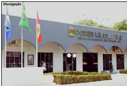
Sessão para apreciação será nesta quarta-feira, dia 23

Audiência Pública acontecerá a partir das 09h30min no Plenário do Poder Legislativo e será a oportunidade para a sociedade debater amplamente a Lei de Diretrizes Orçamentárias para o próximo ano