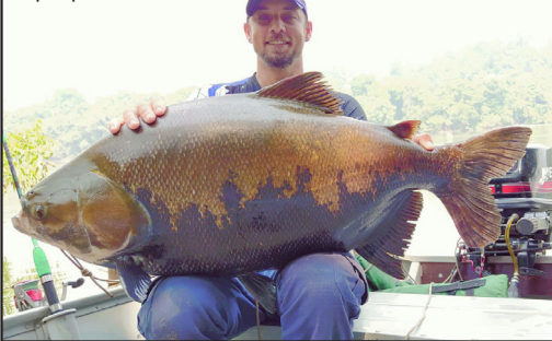
Peixe foi fisgado com molinete no Rio Teles Pires

a fisgada aconteceu por volta das 8 e meia da manhã. “Mas do que era a massa, é segredo”, comentou sorrindo.