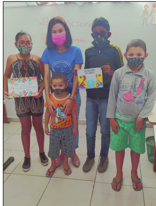
No dia 26 de setembro comemora-se o dia nacional do surdo, e nós do CEEDA parabenizamos todos!