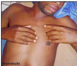
Suspeito foi preso dormindo, depois de invadir mais uma casa

Segundo informações, o suspeito, usando um garfo, foi encurralando a primeira vítima na escola e na hora baixou as vestes mostrando a