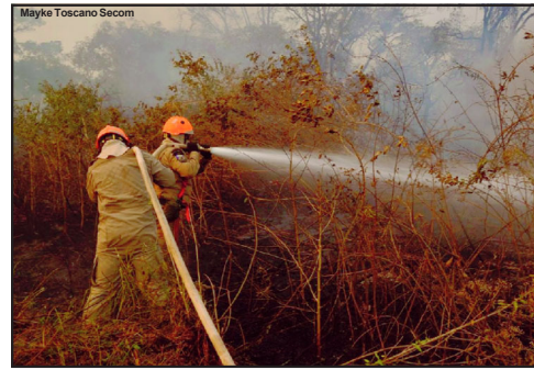
Queimadas no estado são cada vez maiores

De acordo com o governador, o decreto de calamidade vai permitir contratar equipes e materiais em regime de urgência.