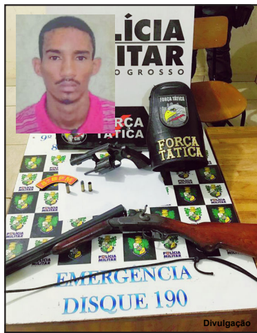
Armas foram apreendidas pela PM

O caso segue apurado pela Polícia Civil.