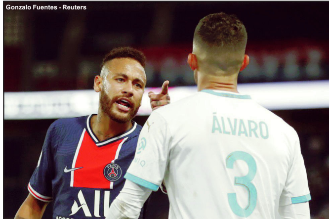
Neymar sofre injúria racial de Alvaro Gonzalez