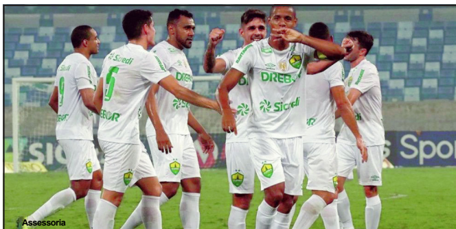
Cuiabá agora se prepara para pegar o Cruzeiro