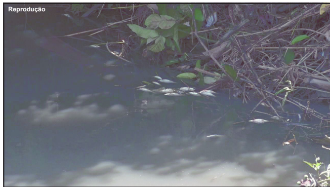
Mortandade de peixes atinge Córrego após vazamento de esgoto

Vazamento de esgoto provocou morte de muitos peixes no Córrego Papai Noel