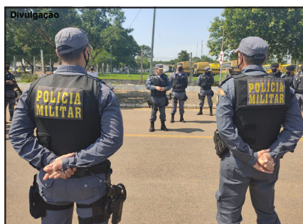
Lançamento da Operação Hórus em AF

Operação foi lançada nesta segunda-feira em Alta Floresta