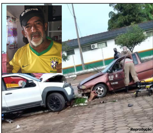
Acidente ocorreu ao amanhecer de domingo, 25

Vendedor de melancia teve perfuração de pulmão e traumatismo