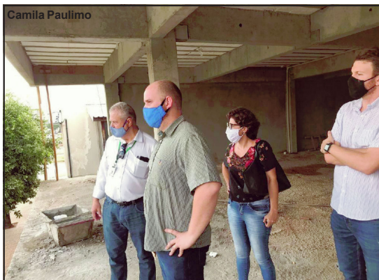
Equipe visitando obras na região norte do estado