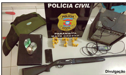
Polícia identificou donos de objetos furtados

Suspeito de 26 anos já tem inúmeras passagens pela Polícia