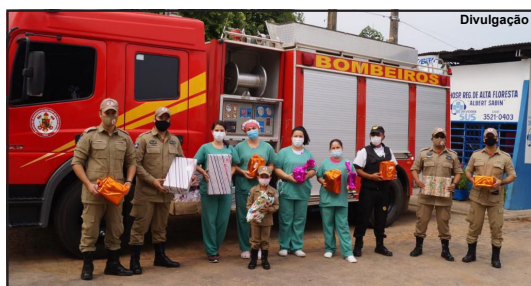
Corporação atendeu famílias e instituições em AF

Atendimento diferenciado na segunda-feira emocionou corporação da 7ª CIBM