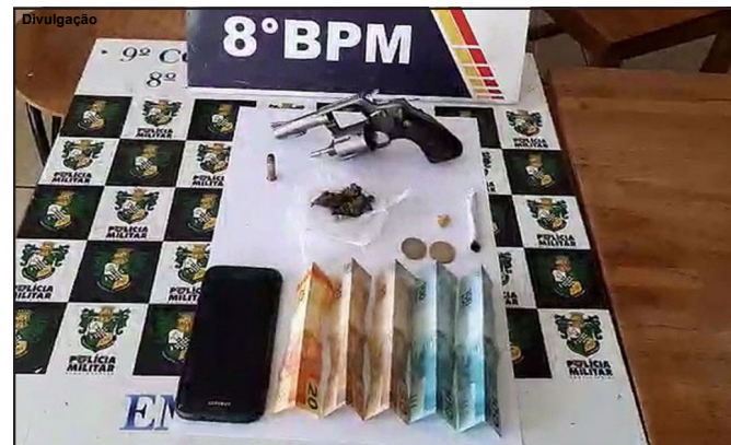
Droga, arma e dinheiro apreendidos com dois suspeitos em AF