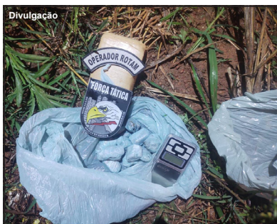
Droga apreendida estava em duas sacolas

Maconha foi apreendida juntamente com balança de precisão e dinheiro