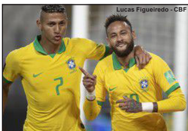
Richarlison e Neymar marcaram os gols do Brasil frente ao Peru

Na noite desta terça-feira a seleção do Brasil foi até Lima e venceu a seleção do Peru no Estádio Nacional por 2-4 pela segunda rodada das Eliminatórias para a Copa do Mundo do Catar 2022. A seleção comandada por Tite conseguiu repetir a boa atuação que teve contra a Bolívia, teve mais resistência pela maior qualidade da seleção peruana que tem jogadores atuando por todas as ligas do mundo e soube reverter dois resultados adversos na partida. O Peru abriu o placar com Carrillo aos 5 minutos de jogo, aos 12 o zagueiro Marquinhos se lesionou e foi substituído por Rodrigo Caio, o zagueiro do Flamengo teve uma boa atuação jogando