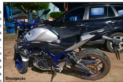
Moto que atropelou ciclista na faixa em AF

A bicicleta teve vários danos e a moto algumas avarias. Mas o ciclista, um jovem também de 18 anos sofreu diversas escoriações pelo corpo. De acordo com o irmão, apesar do grande susto no momento em que a família recebeu o chamado, a vítima se recupera bem. Já o