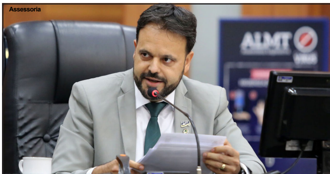
Parlamentar terá agenda cheia em visita aos órgãos de segurança

O município é um dos polos regionais da Região Integrada de Segurança Pública (Risp) de Mato Grosso