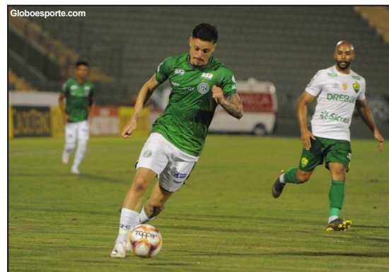
Guarani 1-0 Cuiabá